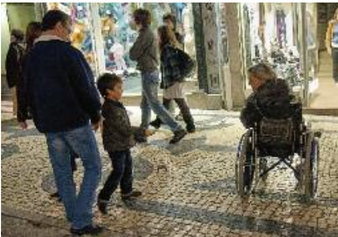
Det svåra ögonblicket i tiggandets dialog.