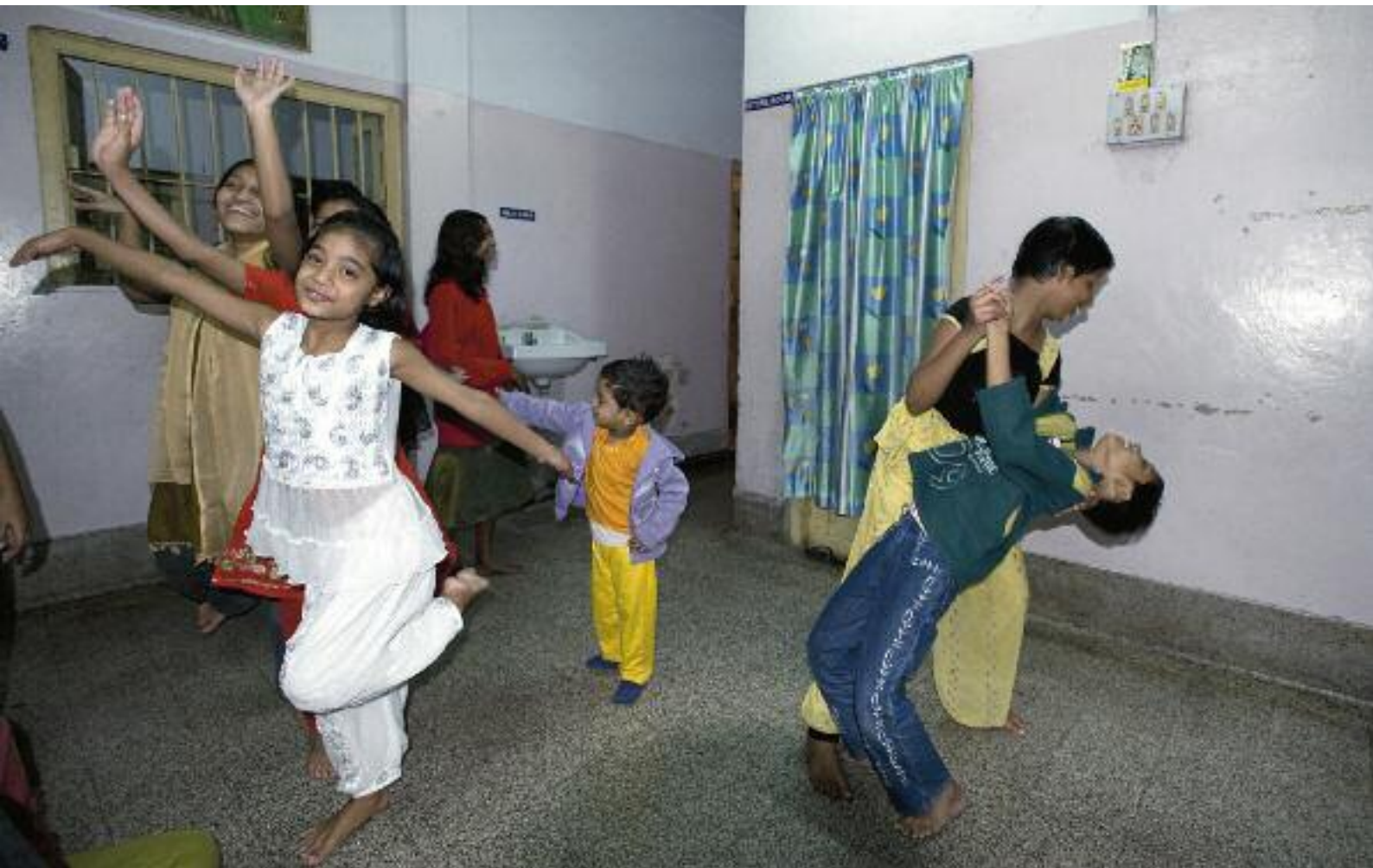
Flickorna på Apanghar dansar med "lillprinsen" i lila cardigan. När hans föräldrar dog i AIDS hamnade han på Anandaghar, centret för HIV-smittade. Men mirakulöst nog var han inte smittad och nu är han alla tjejernas favoritlillebror.

Utöver de boende kommer 117 smittade barn i området till centret för olika typer av stöd, brosmsmedicin eller terapisessioner. Policyn säger att barnen måste vara föräldralösa eller på annat sätt ha omöjliga familjeförhållanden för att få en plats på boendet.