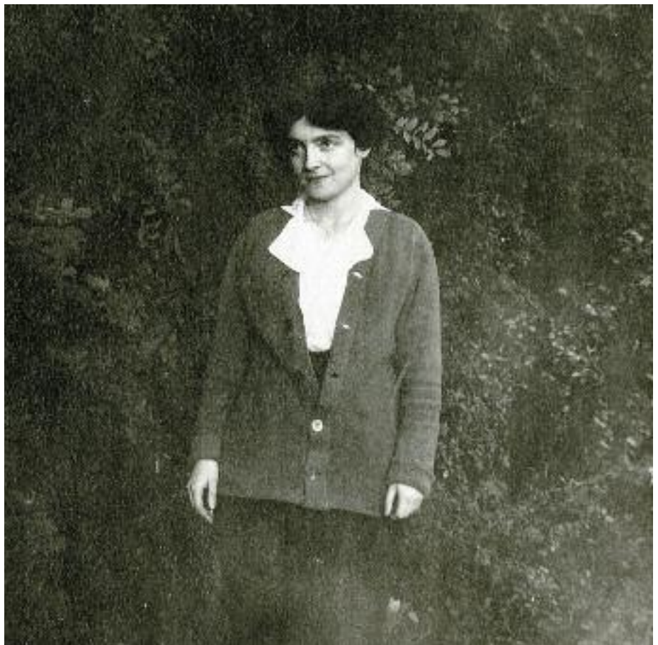
En ungdomsbild på Nelly Sachs, tagen omkring år 1910. Fotografen är okänd.

O skorstenarna är ett exempel på en dikt som finns kvar i det allmänna medvetandet, ett verk som för evigt påminner oss om gasugnarna i nazisternas förintelse-läger: