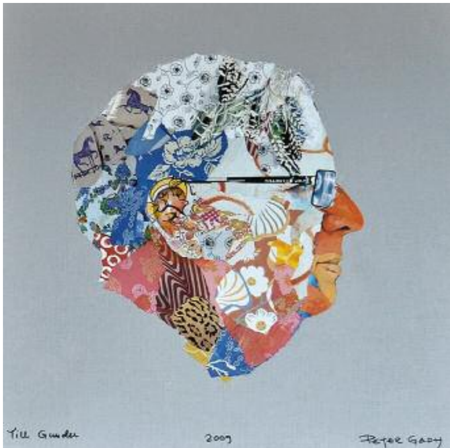
En av Gunder Höögs tavlor.