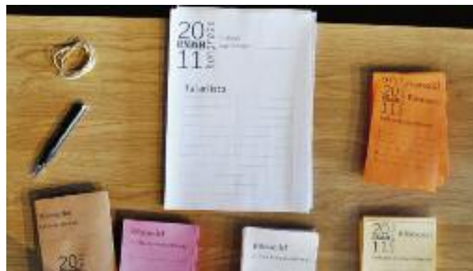
Ett bord med material för att allt ska fungera på bästa sätt, röstsedlar, talarlista – och givetvis en penna.