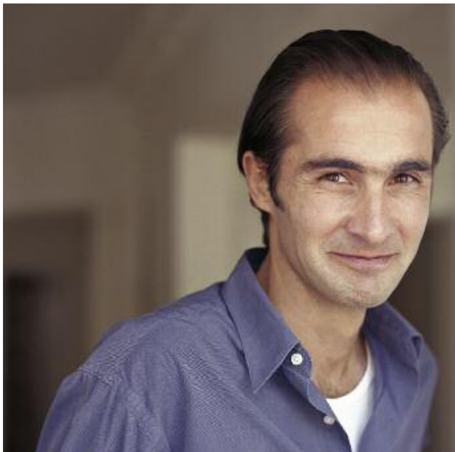
Författaren Aris Fioretos är en av dem som sett till att Nelly Sachs författarskap åter blivit känt för en bredare allmänhet. Foto: Sven Paustian, år 2003.

åren av sitt liv vårdades hon till och ifrån på Beckomberga sjukhus, Sveriges största mentalsjukhus. Något som sannolikt ökade på känslan av utanförskap.