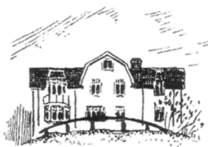
Behandlingshemmet BAGGENSUDDEN www.baggensudden.com

RSMH driver behandlingshemmet Baggensudden för unga kvinnor med s.k. borderlineproblematik. Vi står bakom forskningsstiftelsen Humlan som stödjer forskning med brukarperspektiv, och är en av samarbetsparterna bakom hjälptelefonen Nationella Hjälp!injen .